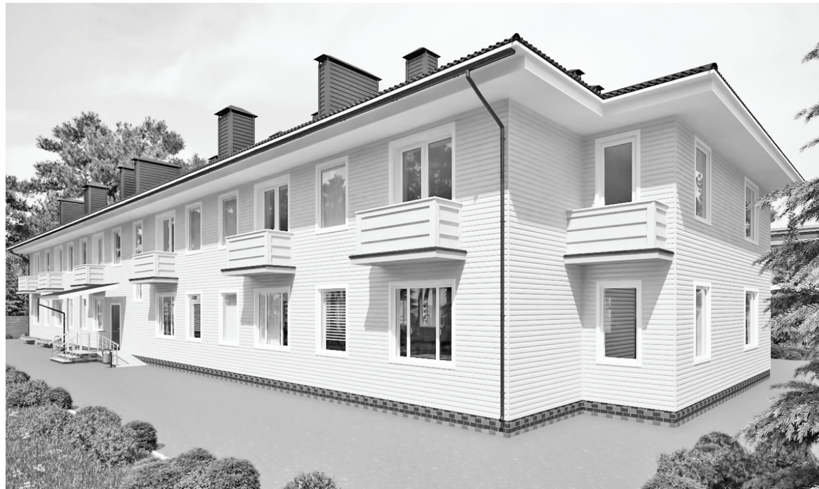
Приблизительно так будет выглядеть новый дом.