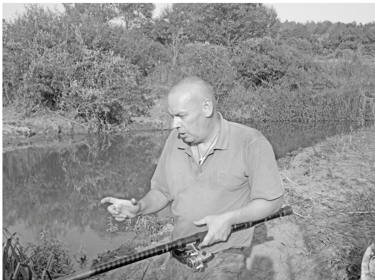
«Вчера клевали вот такие окуньки».

Мы знакомы более полувека. Я с раннего детства ходил пешком из Думиничей в Хотисино, и путь всегда лежал мимо Старого Омута. Чуть ниже, сразу за поворотом речки, был мостик через Брынку – «переход», как его называли. Сейчас от него остался один-единственный столбик, торчащий на берегу.